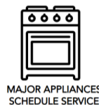
MAJOR APPLIANCES SCHEDULE SERVICE

For information on any of the following items, the full cycle guide, detailed product dimensions, or for complete instructions for use and installation, please visit https://www.kitchenaid.com/service-and-support , or in Canada https://www.kitchenaid.ca/service-and-support . This may save you the cost of a service call.