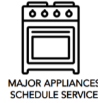
MAJOR APPLIANCES SCHEDULE SERVICE

Pour obtenir des informations sur l'un des points suivants : Guide de programmes complet et dimensions détaillées du produit ou pour obtenir des instructions complètes sur l'utilisation et l'installation, visiter le https://www.kitchenaid.com/service-and-support , ou au Canada https://www.kitchenaid.ca/service-and-support . Cette vérification peut aider à économiser le coût d'une intervention de dépannage.