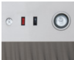
Bright halogen lighting and 4-speed control with illuminated ON/OFF indicator.