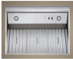
Filtres à graisse à chicane et rails de grand format faciles à retirer.