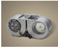
1200 CFM Internal Blower. Tested to ensure operation in corrosive environments.