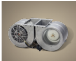
Ventilateur interne de 1 200 pi 3 /min au fonctionnement éprouvé en environnement corrosif.